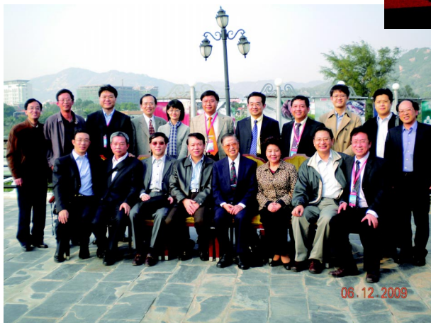
◀ 兩岸醫師午宴後合影。