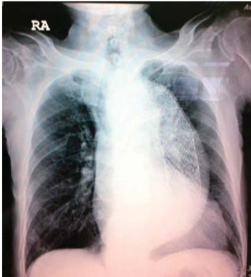
胸部 X 光